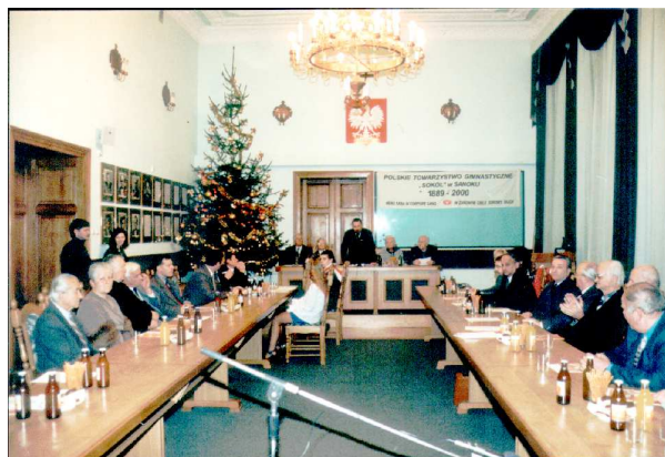
Zebrani w Sali Herbowej – 20.12.2000 r.