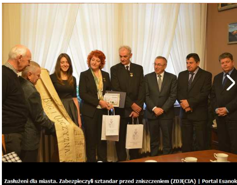
Zasłużeni dla miasta. Zabezpieczyli sztandar przed zniszczeniem (ZDJĘCIA) | Portal Esanok.