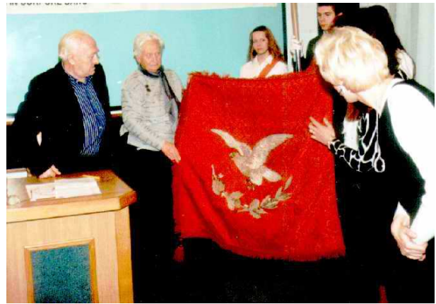
Przekazanie SZTANDARU Zarządowi PTG „Sokół” w obecności notariusza – 20.12.2000 r.